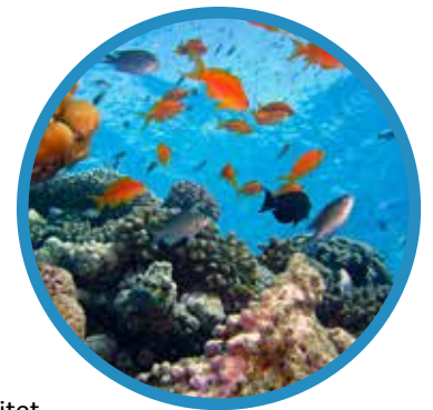
Das sensible Ökosystem Korallenriff

Ein weiteres großes Problem stellen Düngemittel oder Abwässer dar, die in Flüsse oder Meere geleitet werden, denn sie verstärken massiv das Wachstum von Algen. Algen sind grundsätzlich normal und nützlich in Gewässern. Gerät ihr Wachstum jedoch außer Kontrolle, kommt es zu erheblichen Problemen für das Ökosystem: Denn der Abbau von abgestorbenen Algen benötigt viel Sauerstoff, der den Tieren des Gewässers entzogen wird. Resultat ist auch hier, dass Fische und andere Organismen ersticken.