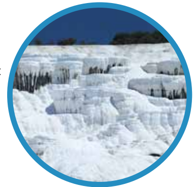
Kalksinterterrassen in Pamukkale, Türkei

Regenwasser, das vom Himmel fällt, beinhaltet keinen Kalk. Es nimmt aber am Weg von der Wolke zum Boden Kohlendioxid aus der Luft auf. Da Wasser so ein hervorragendes Lösungsmittel ist, löst sich das Kohlendioxid und es entsteht Kohlensäure. Trifft das kohlenensäurehaltige Wasser nun auf der Erde auf Kalk oder Dolomit oder sickert durch kalkhaltigen Boden, dann reagiert die Kohlensäure mit diesem Gestein und es entstehen Kalzium- und Magnesiumsalze. Beim Erhitzen oder Verdunsten dieses Wasser entsteht unlösliches Kalziumkarbonat, besser bekannt als Kalk. Kohlensäurehaltiges Regenwasser, das über unlösliche Gesteine wie Granit oder Sandstein fließt, bewirkt keine Bildung von Kalzium- und Magnesiumsalzen. Da unser Trinkwasser aber aus unterschiedlichen Gebieten und Bodenschichten kommt, besitzt unser Wasser immer eine gewisse Menge an gelösten Salzen. Und das ist auch gut so, denn Magnesium und Kalzium gehören zu den für den Menschen überlebenswichtigen Mineralien.