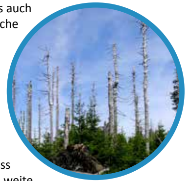
Durch sauren Regen geschädigter Wald.

Bei Menschen wirkt diese Säure stark reizend und ätzend auf Haut und Schleimhäute. Aber auch für die Pflanzen- und Tierwelt ist sie extrem schädlich. Ein zusätzliches Problem besteht darin, dass saurer Regen „wandert“: Das heißt, die Schadstoffemissionen in der Luft können durch den Wind weite Strecken zurücklegen und auch in Gegenden sauren Regen auslösen, in denen die Luftverschmutzung weniger stark ist.